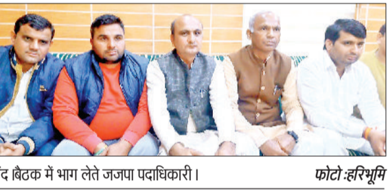
जीड। बैठक में भाग लेते जजपा पदाधिकारी।