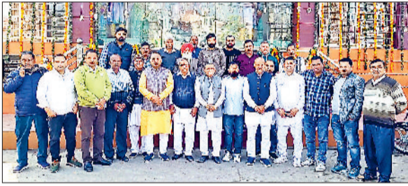
कैथल। महाराजा शूरसेनी को याद करते समाज के लोग।