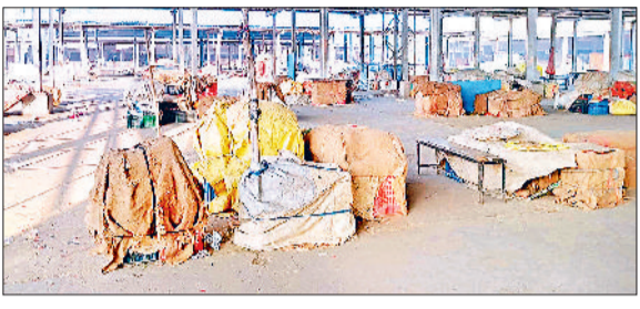
जींद। हड़ताल के चलते खाली पड़ी सब्जी मंडी।