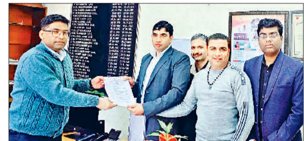
जींद। डीसी को ज्ञापन सौंपते चिकित्सक।

जलघर बनाने की मांग 20 साल से की जा रही है। यह मांग अब पूरी हो गई है। डॉ. श्यामा प्रसाद मुखर्जी मिशन के तहत ये जलघर बन रहा है। डॉ. श्यामा प्रसाद मुखर्जी योजना में हलके के कई गांव बीती सरकार में केंद्र सरकार द्वारा शामिल किए गए थे।