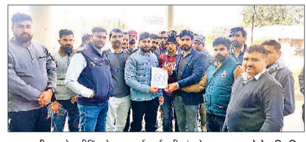
गुहला चीका। गेट मीटिंग के बाद सर्व कर्मचारी संघ के सदस्य।