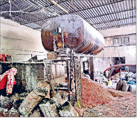
जीद। फैक्टरी में काम करते हुए मजदूर व बदबू के चलते मुंह ढांपे हुए मजदूर।