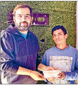
हरिभूमि न्यूज ▶▶ पंडरी

3 परिवारों में बेटियों के जन्म लेने पर उपहार स्वरूप भेंट की 5100-5100 रुपए की राशि