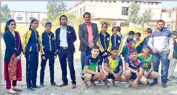
राजौड़। एसडीएम स्कूल में चल रही खेलकूद प्रतियोगिता के दौरान विजेता खिलाड़ियों के साथ स्कूल स्टाफ सदस्य।