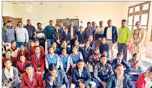
राजौड़। कार्यक्रम भाग लेते हुए विद्यार्थी।