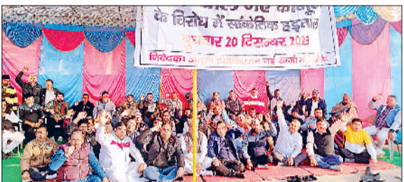
जींद। सब्जी मंडी पर ताला जड़ रोष जताते आड़ती।

सब्जी तथा फलों के रेट बढ़ जायेंगे। जिससे आम आदमी को जेब भी ढीली होगी। एक मुश्त फीस का प्रभाव आड़ती पर पड़ेगा। सरकार को तुरंत प्रभाव से इसे वापस लेना चाहिए। सब्जी मंडी कार्य दिवस में अलसुबह गुलजार हो जाती है। किसान सब्जी बेचने आते हैं तो सब्जी तथा फल खरीदने दुकानदार