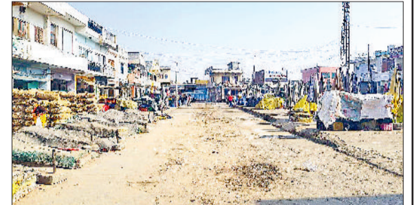
कैथल। हड़ताल के चलते खाली पड़ी की सब्जी मंडी।

सब्जी मंडी में सन्नाटा पसरा रह जाँद सब्जी मंडी में आसपास के दर्जनभर गांवों के किसान हर रोज ताजी सब्जी बेचने यहां पर आते हैं। यहीं से रेहड़ी तथा फड़ी वाले, दुकानदार फल तथा सब्जी खरीदते हैं। नारनौद तथा असंध को भी सब्जी तथा फल यहीं से सप्लाई होती है। सब्जी मंडी के बंद होने के कारण किसानों की सब्जी नहीं बिकी। शहर में सब्जियों की रेहड़ी भी कम दिखाई दी। जो गलियों में फेरी लगाते हैं। वे भी दिखाई नहीं दिए। सब्जी मंडी एसोसिएशन के