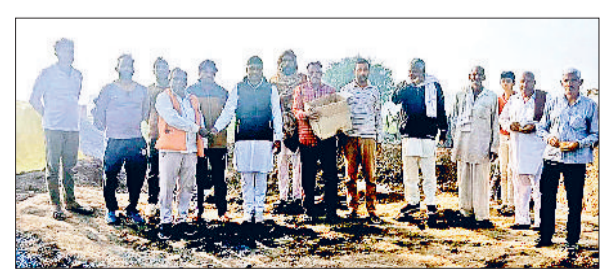
उद्याना। जलघर का निर्माण कार्य शुरू होने की जानकारी देते ग्रामीण।

हलके के भगवानपुरा गांव की 20 साल पुरानी मांग पूरी हुई है। गांव में पीने के पानी की किल्लत से परेशान गांव के लोग जलघर बनाने की मांग कर रहे थे। डॉ. श्यामा प्रसाद मुखर्जी मिशन के तहत जन स्वास्थ्य विभाग ने जलघर का निर्माण कार्य किया जाएगा। 1. 80 करोड़ रुपये इसके निर्माण सहित अन्य कार्यों पर खर्च किए जायेंगे। दरलेही खेड़ी के जलघर से पीने का पानी भगवानपुरा पहुंचता है। टैंक लगभग 25 लाख